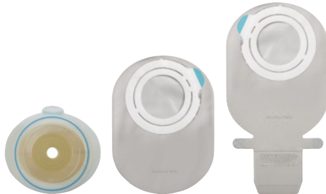
SenSura Mio Flex 2-delsbandage