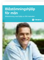
Blåstömningshjälp för män – Blåstömning med hjälp av RIK