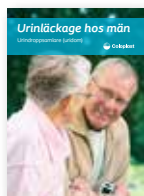
Urinläckage hos män – Urindroppssamlare (uridom)