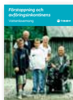
Förstoppning och avföringsinkontinens – Vattenlavemang