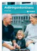
Avföringsinkontinens – Analpropp