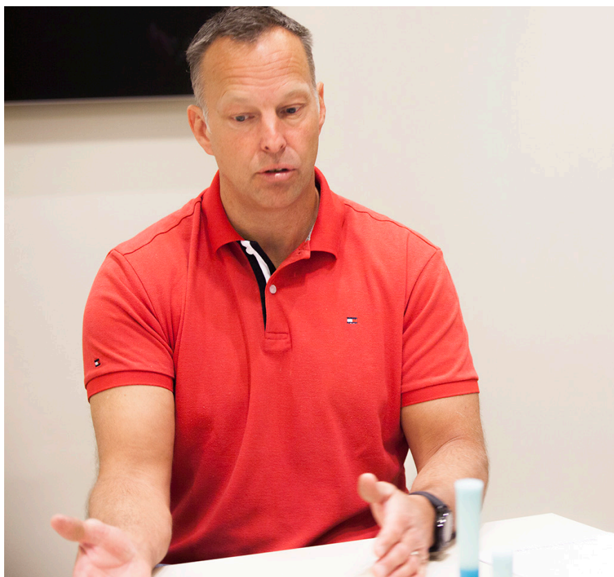
Alla ska kunna ha den möjligheten; att kunna få tillgång till de hjälpmedel som krävs för att kunna vara en del i samhället.